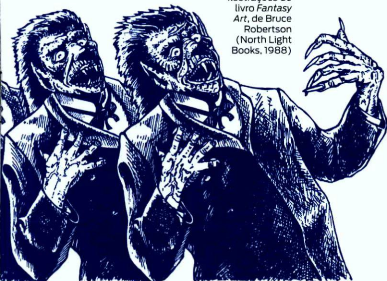
Ilustrações do livro Fantasy Art , de Bruce Robertson (North Light Books, 1988)