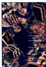
Antologia da literatura fantástica , organizada por Luis Borges, Adolfo Bioy Casares e Silvina Ocampo (Cosac Naify, 448 págs., R$ 69)

Para a antologia, foi selecionado o conto O Espelho de vento-e-lua . Digno de Allan Poe e Kafka, nas palavras do autor de O Aleph e Ficções , o texto narra a história de um doente que recebe de um mendigo taoísta um espelho capaz de curar as doenças da alma e, como o leitor descobrirá, satisfazer outros desejos.